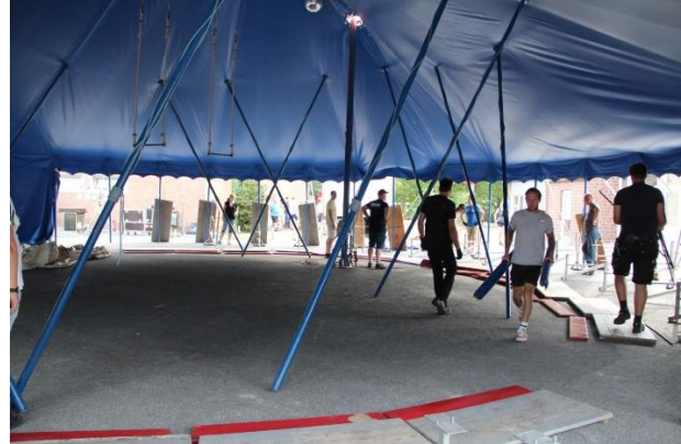
Viele Hände packen mit an.