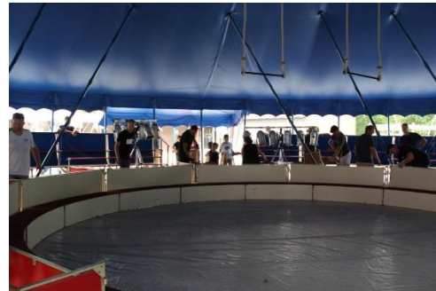
Und alles bei bestem Wetter und bester Stimmung!