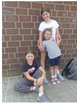
Viele kleine Zuschauer voller Vorfreude!