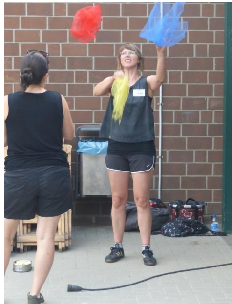
Das Üben hat alle gepackt...